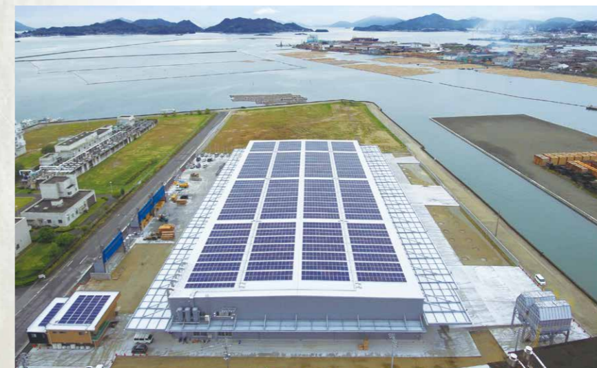
福山工場(広島県福山市)