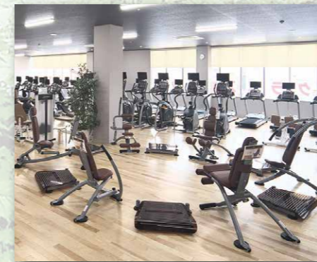
スポバル緑町クラブ