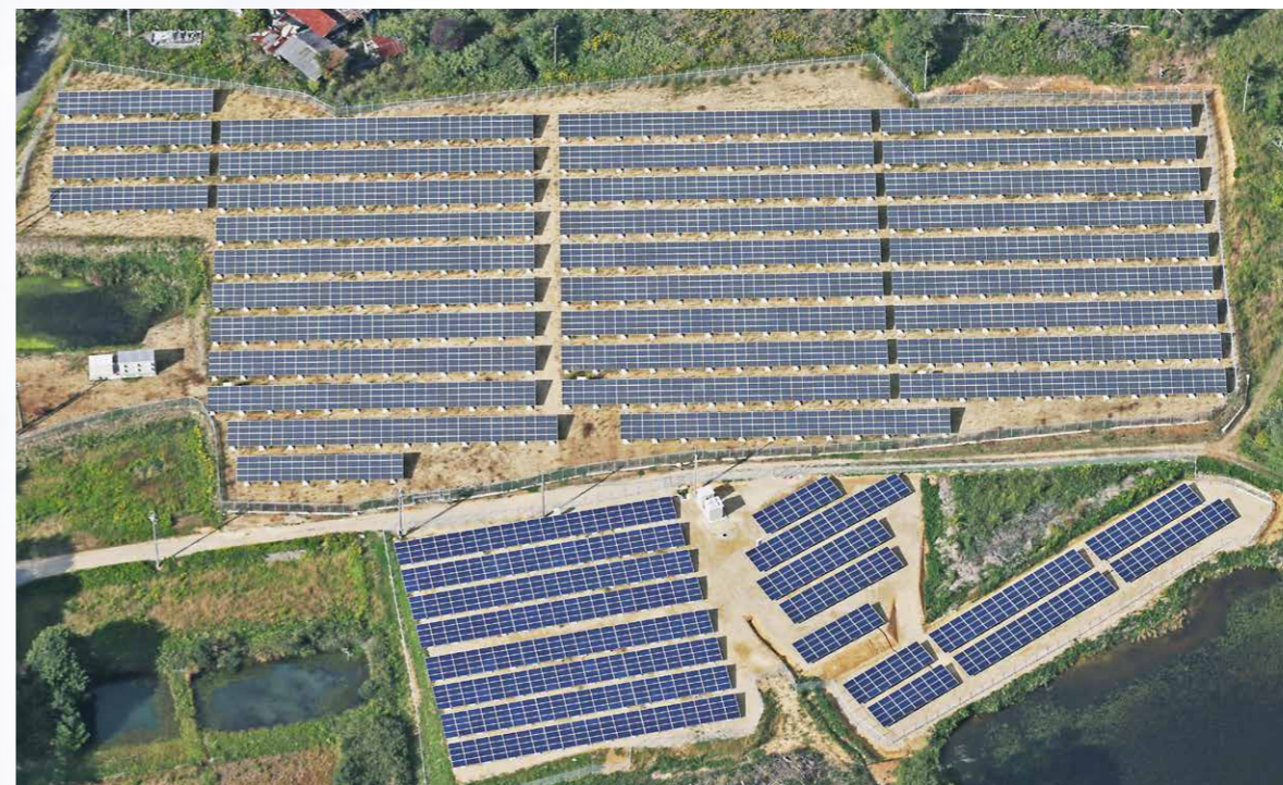
広島県世羅郡のメガソーラー(945.00kW+330.40kW増設)

これまでにハウス事業で培った建築士による設計・構造計算、電気施工管理士による電気システムの設計、鉄骨のスペシャリストによる鉄骨架台の施工管理、その他優秀なスタッフによる補助金等の申請手続きのお手伝いやアフターサービス、これらの一貫したサービスのご提供がオービスの最大の特徴です。