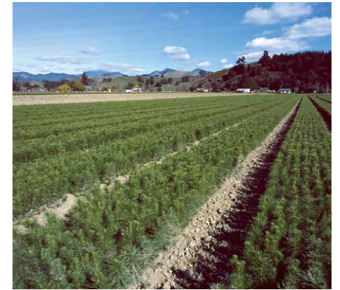
ラジアータパインの苗木畑

ラジアータパインの大きな特徴は、成長が早い植林材であるということです。ニュージーランド政府の政策により森林資源の活用が図られ、計画的に伐採、植林が行われるため、枯渇することなく安定的に供給が受けられる資源であると考えられております。環境問題がクローズアップされる昨今、植林により常に新しい森林を生み出し、育てるラジアータパインは、二酸化炭素削減に貢献できる“地球にやさしい”木材であると考えられております。近年では品種改良が進み、ラジアータパインは25年という短期間で成木になるといわれております。