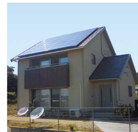
住宅用太陽光発電システム(4.44kW)施工例

産業用の太陽光発電の全量買取制がスタートしたことにより、需要が急激に拡大し、1000kW以上=1メガワットの発電力をもつ太陽光発電システムを設置して発電事業へ参入する企業も増加しました。