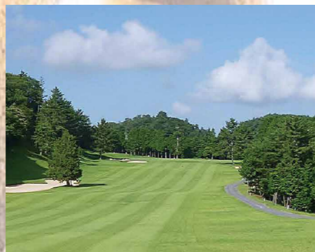
中須ゴルフ倶楽部

山口県周南市にある中須ゴルフ倶楽部は、18ホール全長7,125ヤードのワイドでフラットなロングコースで、かの中村寅吉が設計した名門コースとして皆様から長年ご支持とご愛顧をいただいております。クラブハウス内の弱アルカリ温泉「名物天然大岩風呂」は、日頃の疲れを癒し、明日への活力を与えてくれると好評をいただいております。