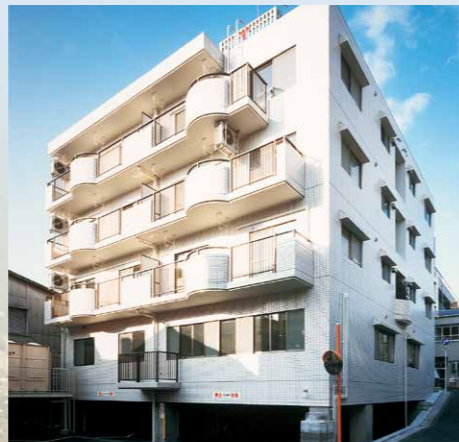
アーバン中浜(広島県広島市)

不動産事業では、広島県内の4ヶ所に賃貸マンションを所有し、賃貸事業を行っております。福山市の物件におきましては、一般賃貸に加え、ウィークリータイプのマンションとしてのサービスも行っており、低価格な料金設定により好評をいただいております。リピーターの確保にも努めております。