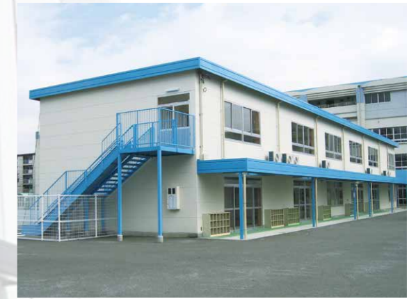
プレハブハウス施工例