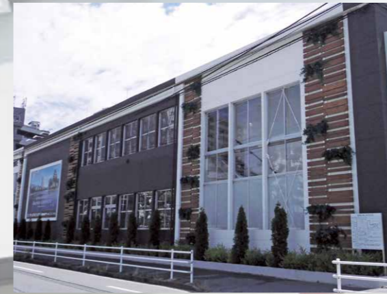
プレハブハウス施工例

プレハブハウスの最大の特徴は、工期の短さと低価格という手軽さ。しかしながら近年では、耐震性や安全性を厳しく求められています。オービスのプレハブハウスは、安全性と利便性を融合させた次世代のプレハブハウスです。短期間の仮設ハウスのリースから常設の店舗等の販売まで、お客様の様々なニーズに対応した細かなサービスで、安心安全の快適環境をご提供いたします。